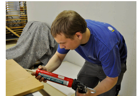
Schreiner/in Kreative Handwerker mit Ideen