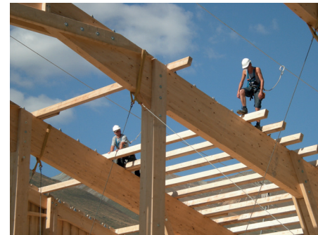
Zimmermann / Zimmerin Flexible Teamplayer mit Power