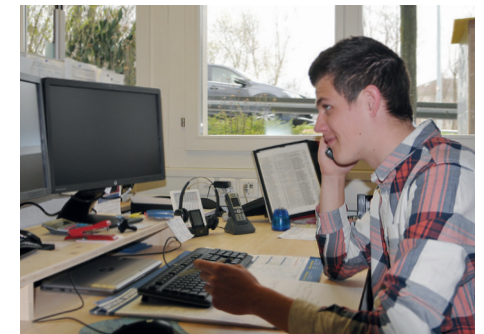
Kaufmann / Kauffrau Vielseitige Allrounder mit Engagement