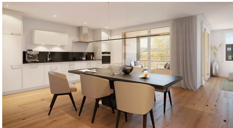
Visualisierungen ohne Gewähr

17 x 5.5 Zimmer Wohnungen, Nettowohnflächen von 132 bis 140 m 2 ab CHF 725'000